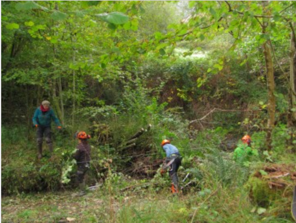
Avant et .....après le travail de toute l'équipe