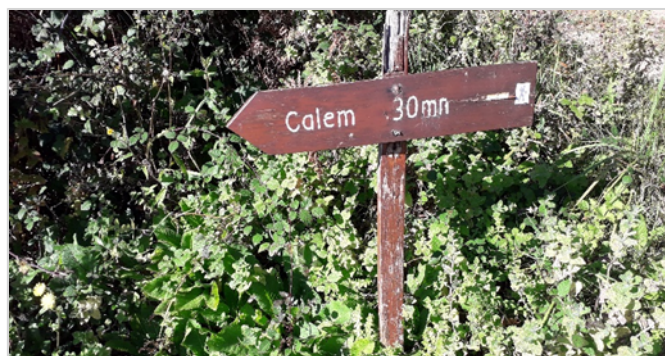
Chemin du Calem